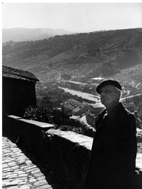
Giovanni Michelucci a Collodi (Pescia), sullo sfondo l'Osteria del Gambero Rosso nel Parco di Pinocchio.